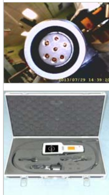
Mallette de rangement & Accessoires ENDOCYB